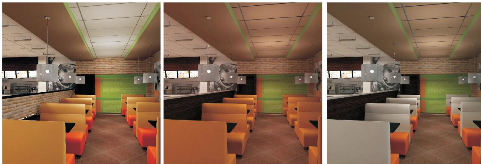
Варианты цветового решения диванов и подвесного потолка