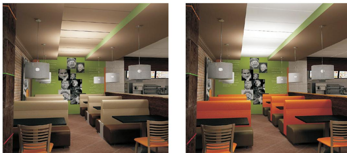
Варианты цветового решения диванов и подвесного потолка